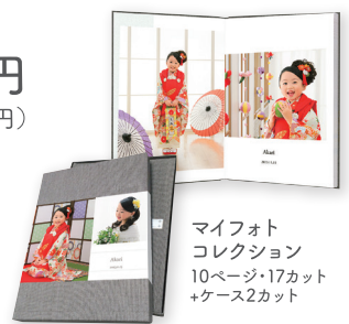
マイフォト コレクション 10ページ・17カット +ケース2カット