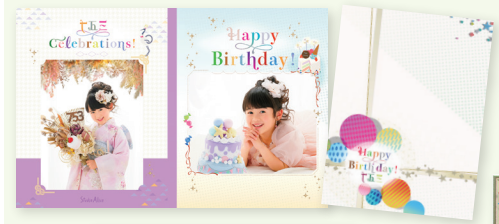
マイフォト コレクション スマイル 10ページ・8カット +表紙2カット