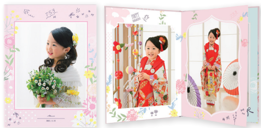
マイフォトコレクション スマイル 4ページ・4カット+表紙2カット