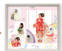
BOXフレーム デザインフォト 4カット