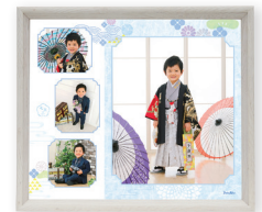
BOXフレームデザインフォト 4カット