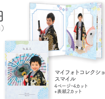
マイフォトコレクション スマイル 4ページ・4カット +表紙2カット