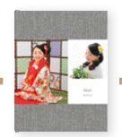
ミニスマイル 10ページ・17カット +表紙2カット