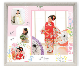
BOXフレームデザインフォト 4カット