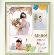
アートフレームデザインフォト 3カットハッピー