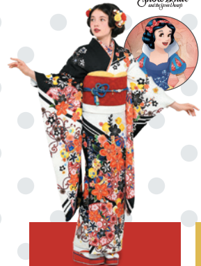
白雪姫 Snow White