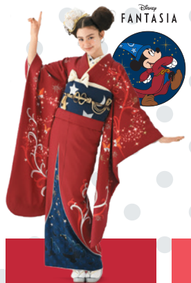
ミッキーマウス ファンタジア Fantasia