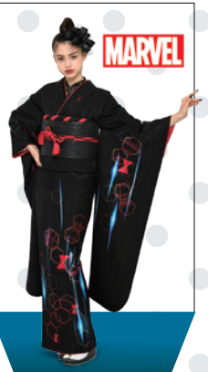
ブラック・ウィドウ Black Widow

他にも「スター・ウォーズ」や「マーベル」、「ピクサー」などのデザイン振袖もご用意しています。