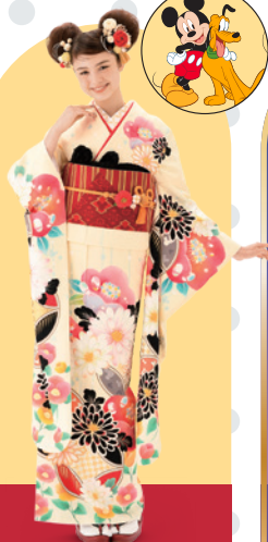
ミッキー&プルート Mickey & Pluto