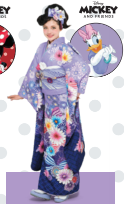
デイジーダック Daisy Duck