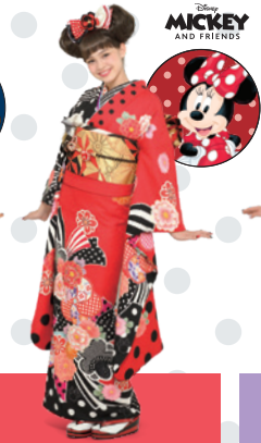
ミニーマウス Minnie Mouse